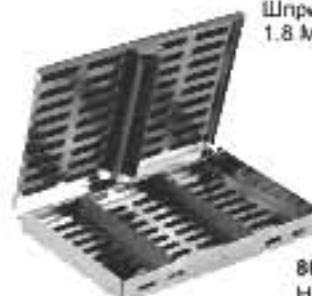
80-806 Set of 20 Pieces Набір із 20 інструментів