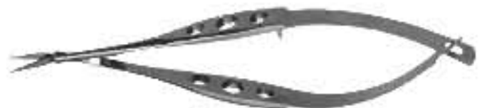
80-800 Surgical Scissors Castro 45° Хірургічні Ножці Castro 45°