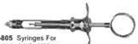
80-805 Syringes For Aspirated 1.8ml Wing Шприц для відсмоктування 1.8 мл Wing