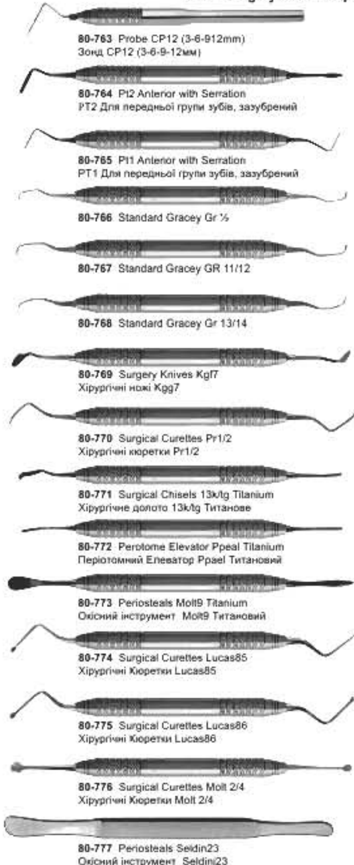
80-763 Probe CP12 (3-6-9-12mm) Зонд CP12 (3-6-9-12мм)