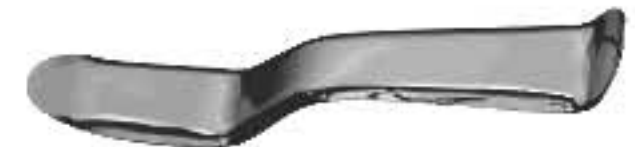
80-781 University of Minnesota