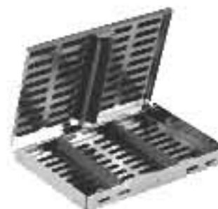
80-786 Set of 24 Pieces Набір із 24 інструментів