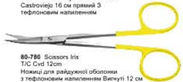
80-780 Scissors Iris T/C Cvd 12cm Ножиці для райдужної оболонки з тефлоновим напленням Вигнуті 12 см