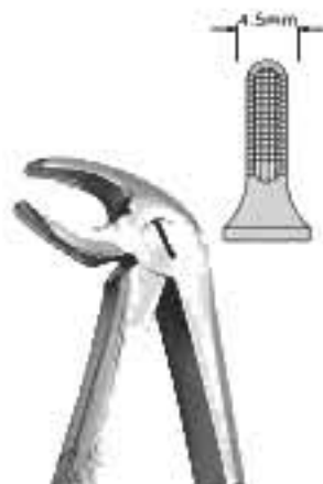
80-043 Fig. рис. 13 Lower Premolars/ Bicuspid Premolari Inferiori Для нижніх премолярів / Передньо-кореневих зубів