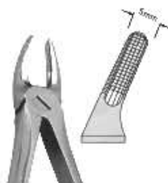
80-041 Fig. рис. 7 Upper Premolars/ Bicuspid Premolari Superiori Для верхніх премолярів / Передньо-кореневих зубів