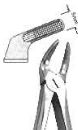
80-042 Fig. рис. 8 Lower Premolars/ Bicuspid Premolari Inferiori Для нижніх премолярів / Передньо-кореневих зубів