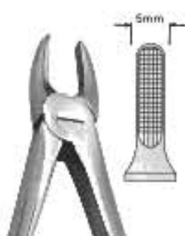
80-039 Fig. рис. 2 Upper Laterals & Canines/Cuspids Incisivi e Canini Superiori Для верхніх середніх різців та іклів