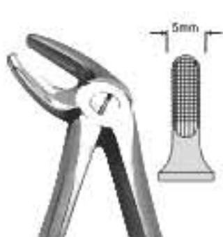
80-040 Fig. рис. 4 Lower Incisors & Canines/Cuspids Incisivi e Canini Inferiori Для нижніх різців та іклів