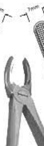
80-045 Fig. рис. 18 Upper Molars, Left Molari Superiori, Sinistri Для верхніх молярів, зліва