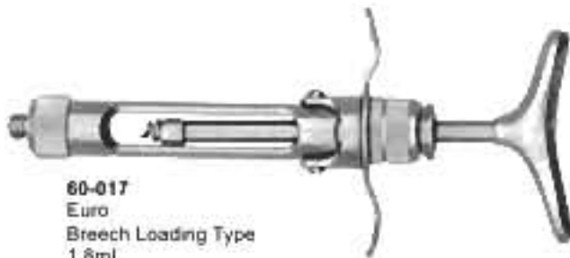
60-017 Euro Breech Loading Type 1,8ml. Європейський тип, заряджається з казенного боку 1,8мл.