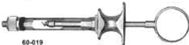
60-019 Euro Type 1,8ml. Європейський тип 1,8мл.