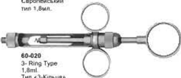
60-020 3- Ring Type 1,8ml. Тип «3-Кільця» 1,8мл.

Manual Aspirating Syringes Шприци для ручного відсмоктування