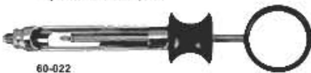
60-022 Type A 1,8ml. Тип А 1,8мл