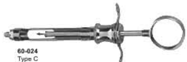
60-024 Type C 1,8ml. Тип С 1,8мл