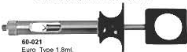
60-021 Euro Type 1,8ml. Європейський тип 1,8мл.

Manual Aspirating Syringes Шприци для ручного відсмоктування