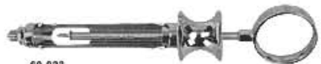
60-023 Type A 1,8ml. Тип А 1,8мл