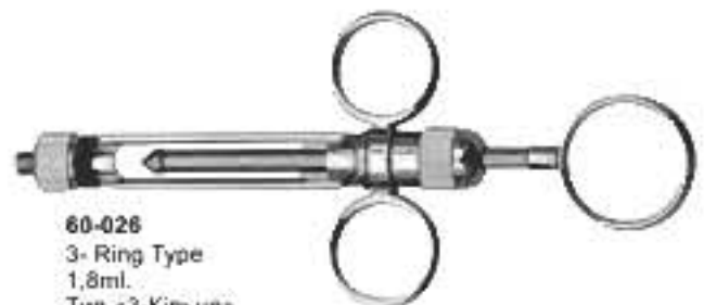
60-026 3- Ring Type 1,8ml. Тип «3-Кільця» 1,8мл