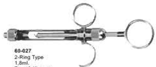
60-027 2-Ring Type 1,8ml. Тип «2-Кільця» 1,8мл