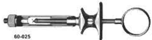
60-025 Euro Type 1,8ml. Європейський тип 1,8мл